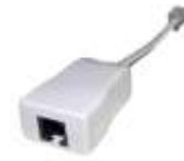
2 filtres simples